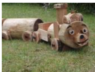
汽車ポップベンチ