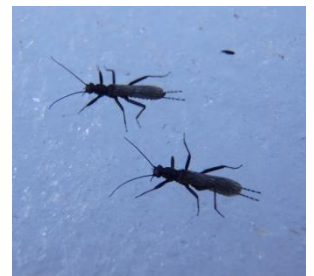
<セッケイカワゲラ ②>