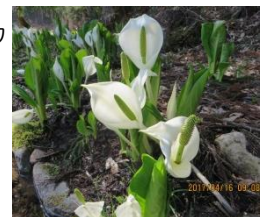
<園内のミズバショウ>

ミズバショウは人間にとって有毒植物ですが、クマにとってはなくてはならない「薬用」?植物で、この点は「薬食同源」といったところでしょうか。(千葉)