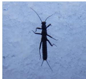
<セッケイカワゲラ ①>