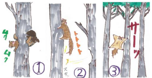
＜(は)さんのお孫さんによるイメージ画＞