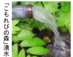
「こもれびの森」湧水

今年の梅雨は、例年に比べ雨量が少ないといわれています。そんな中でもコンコンと流れ出る湧水が科学館の裏山にあります。雨が少なからうと、大雨にならうとも、透明な天然水は湧き出ています。この天然水を使ったコーヒーは、味わいがあります。また、冷たいのでスイカを冷やすのにとっても便利です。ご来館の折にはお味と、冷たさを体験していただきたいと思います。