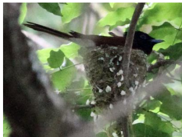
＜①抱卵中の サンコウチョウ＞