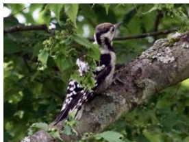
＜②オオアカゲラ幼鳥＞