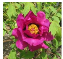
「座った姿のポタン」

しかし、この3つの植物はすべて婦人病に効果があるとされる薬用植物で、この観点から異なった解釈もあるようです。例えば「シャクヤク」の根は鎮痛・冷え性に、「ポタン」の根皮は下腹部のしこり・産後の諸症状に、「ユリ」の鱗莖は滋養強壮・乳腺炎に効果があるとされます。女性が立ち上がってフラフラしないように、座ってばかりいて血が溜まらないように、そして歩くときはナヨナヨしないように、と、これらの生薬の効能を暗示したことわざであるというものです。つまり、これらの薬草を用いると明るく健康的で、美しい女性になれるというものです。男性にもこんな薬用植物があればすぐ飛びつきたいものです。(千葉)