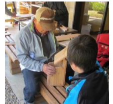
＜おじいちゃんと一緒に＞