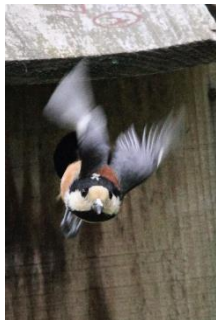
＜①巣箱から飛び親鳥＞