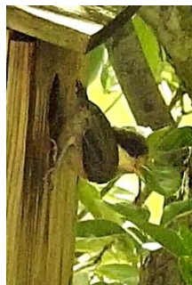
＜③飛び立とうとするヒナ＞