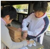
＜お母さん頑張ってます!＞

当日は、親子での参加や、お孫さんと一緒のおじいちゃんまで、10才程から70代??位までの皆様が、巣箱をつくるという目標に向かい楽しい一日を過ごされました。