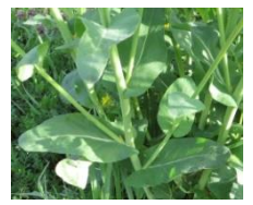
〈菜の根元は茎を抱く〉