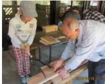
〈おじいちゃんと一緒に〉