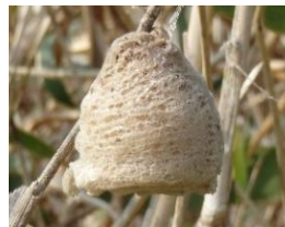
②チョウセンカマキリの卵