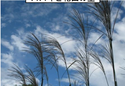
ススキと花山の空