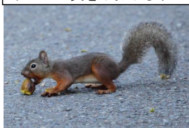
クルミの実をほおぼるリス