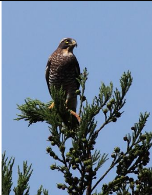
木のこずえで獲物を狙うオオタカの幼鳥