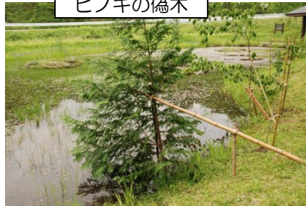
ここにイモリがいます