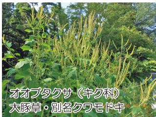
オオバタクサ (キク科) 大豚草・別名クワモドキ

花粉症の原因植物は春から秋にかけて生育しています。秋はブタクサ・カナムグラ・ヨモギが3大原因植物と言われていますが、ここでは2種紹介します。