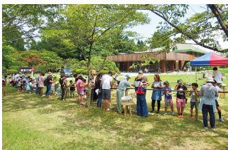
芝生広場さん、ありがとう&さようなら！