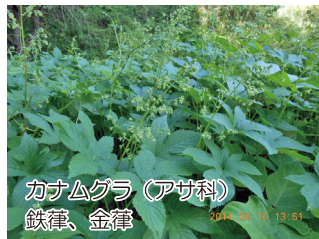
カナムグラ (アサ科) 鉄律、金律

ブタクサの名前は英名を直訳したものです。また、別名のクワモドキは、葉の形が桑の葉に似ていることから名づけられました。北米原産の一年草の風媒花で、1952年に清水港で見つかり、各地河川敷などに広がっています。(駒野)