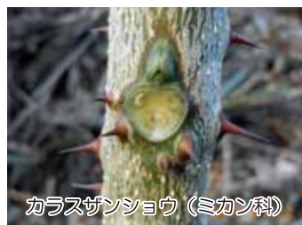
カラサンショウ（ミカン科）