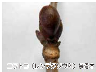
ニワトコ（レンブクソウ科）接骨木

葉痕は隆起し T 字型で大きく、ヒツジの顔に似ています。鼻の部分が何とも言えない雰囲気を出していますが、写真は怒っているようなちょっと怖い顔です。