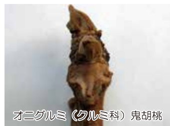
オニグルミ（クルミ科）鬼胡桃

落葉樹の葉が枯れ落ちた葉痕に、子供の顔や動物の顔などのユニークな姿を見ることが出来ます。面白い顔の正体は葉が元気な時、茎や葉柄で水分や養分を通した管の痕跡です。見過ごしてしまいそうな程の大きさです。（駒野）