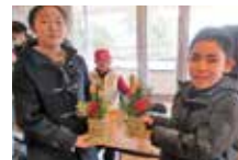
ミ二門松で迎春 (12/16 竹クラフト講座)