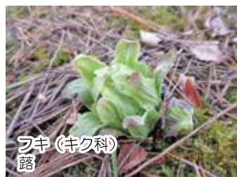
フキ (キク科) 露