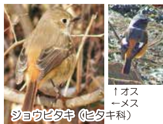
↑オス ←メス シヨウビタキ (ヒタキ科)