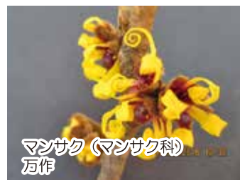
マンサク (マンサク科) 万作