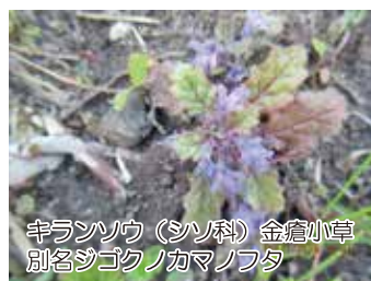
キランソウ(シソ科) 金倉小草 別名ジゴクノカマノフタ

雌雄異株植物です。果実が赤く熟している先に雌花が開花し、その近くには花粉を付けた雄花が咲いています(駒野)