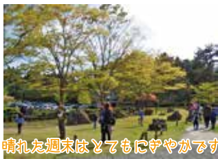
晴れた週末はとてにぎやかです