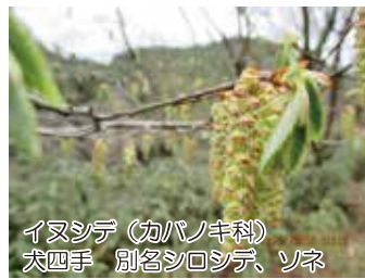
イヌシデ(カバノキ科) 犬四手 別名シロシデ、ソネ

名前は唇弁がランの花を想像し、花が紫色で紫欄草。これがなまり“キランソウ”。別名は咳、解熱など薬効があり、地獄に行くはずだった人が、これを煎じて飲むと、病が治り、地獄の釜の蓋が閉まり生き返えるという意味です。(駒野)