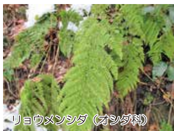
リョウメンシダ(オシダ科)

春先に新葉が出ると、前年の葉が散るので「譲葉」に。成長した子供に後を託し譲るのに例えた、おめでたい木として正月の飾りに使われます。赤い葉柄が目立ち、葉が寒そうに下向きに垂れ下がっています。(駒野)