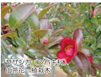
サザンカ(ツバキ科) 山茶花…植栽木

椿の漢名の「山茶花」が、サザンカの名前として間違っただけです。一般には葉が大きく花弁や雄しべが筒状のものがツバキ、葉が小さく花弁や雄しべが分かれて散るのをサザンカと呼んでいます。(駒野)