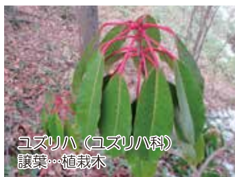
ユズリハ(ユズリハ科) 譲葉…植栽木

椿の漢名の「山茶花」が、サザンカの名前として間違っただけです。一般には葉が大きく花弁や雄しべが筒状のものがツバキ、葉が小さく花弁や雄しべが分かれて散るのをサザンカと呼んでいます。(駒野)