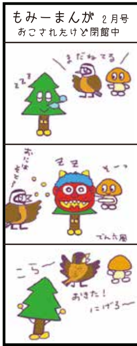
もみーまんが 2月号 あこされたけど閉館中

この施設開設の時に植えられたものですが、時を経て今や大木(高さ約15m、幹まわり1.5m超)になっています。常緑でドングリをつける親しみやすさから、公園樹として多く見られます。(工藤)