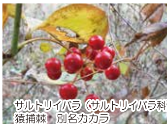
サルトリイバラ(サルトリイバラ科) 猿捕棘 別名カカラ

名前は、猿捕りイバラからで、刺のあるつるにサルもひっかかるといことです。赤い液果がたわわに熟しています。根茎は薬用になります。(駒野)