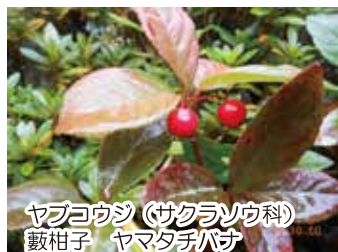
ヤブコウジ(サクラソウ科) 藪柑子 ヤマトチハサ

名前は、猿捕りイバラからで、刺のあるつるにサルもひっかかるといことです。赤い液果がたわわに熟しています。根茎は薬用になります。(駒野)