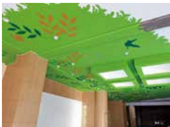
ケヤキの木が生えているかのような内装

中央記念館の館内展示物リニューアル工事のため、引き続き館内立ち入り禁止となります(2月末まで予定)。しばらくの間ご不便をお掛け致しますが、どうぞご了承下さい。なお、園内散策やアスレチック等は通常通りお楽しみ頂けます。トイレは駐車場入口のトイレをご利用下さい。