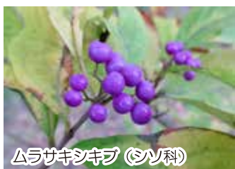
ムラサキシキブ (シソ科)

名前は諸説ありますが、紫色の美しい果実を源氏物語の作者紫式部に例えたものです。落葉低木、高さ3mほど。紫色の果実が熟してきました。別種に丈が低く実付きの良いコムラサキがあります。(駒野)