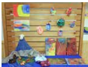
虹のこども園・作品たち