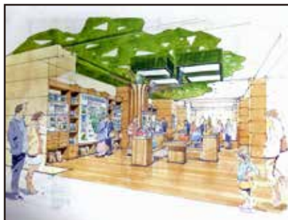
展示リニューアルイメージ

昨年10月に中央記念館外壁や内装の木質化リニューアル工事が終了しましたが、この度最後に残されておりました、中央記念館の館内展示リニューアル工事が行われます。工事に伴い12月1日より館内は立ち入り禁止となります。しばらくの間ご不便をお掛け致しますが、来年3月のリニューアルオープンをどうぞ楽しみにお待ち下さい。