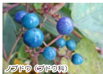
ノボドウ (ゴドウ科)

名前は諸説ありますが、紫色の美しい果実を源氏物語の作者紫式部に例えたものです。落葉低木、高さ3mほど。紫色の果実が熟してきました。別種に丈が低く実付きの良いコムラサキがあります。(駒野)