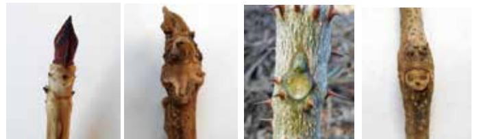
アジサイ オニグルミ カラスザンショウ クズ