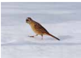
えまないかな… (ホオジロ メス)