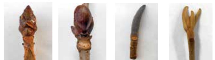
トチノキ ニワトコ ホオノキ アワブキ