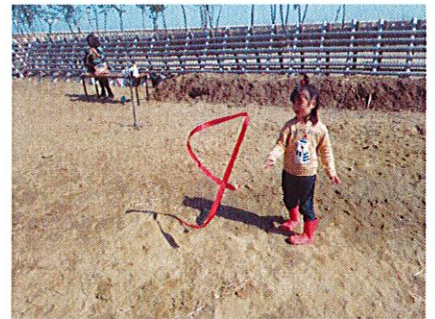
海岸林でも工作と遊び