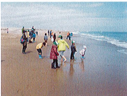
きれいな海岸 山元町