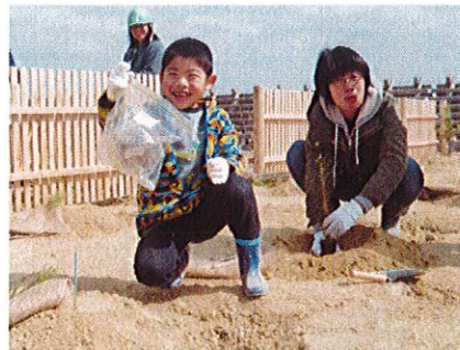
掘ったら何か出てきた