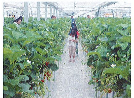
いちご狩りのご褒美 山元町

未来の海岸部の暮らしを守ったり、海岸付近のたくさんの生き物の棲みかとなる海岸林なので、一度は海岸林再生植樹活動に参加しましょう。将来、海岸林が大きく成長したときに、「ボクが植えたんだ」と自慢できるように、子どもたちに海岸林植樹の機会を与えてあげて下さい。