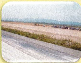
クロマツを植樹するための盛土工事