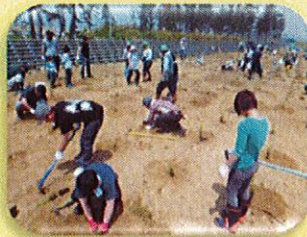
一般親子等による植樹