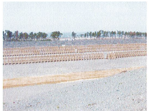
海岸林植樹地の様子