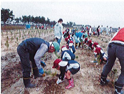
植樹活動 幼稚園大部隊