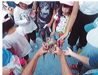
リアル タコ セービング