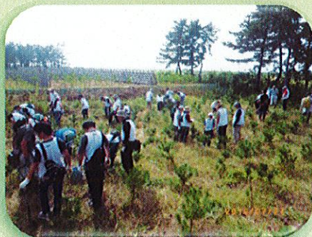
写真の活動：大日本印刷株式会社