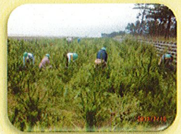
苗木を育てるための除草 下刈り活動