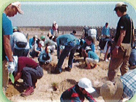
写真の活動：日機装株式会社