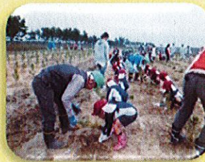
学校・幼稚園による植樹